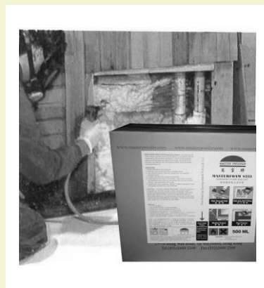
DIN 4102 Part 1

聚胺脂預聚物 15 - 30kg/m 3 35-100 kpa 150 kpa 8-20% 22-50 kpa 60-70% <0.035Kcal/mH o C 0.3 %Vol +5 o C - +40 o C +12 o C - +35 o C B2 PVC - PVC>100kPa Alu - Alu>80kPa 在 23 o C 下，可存放 1 年